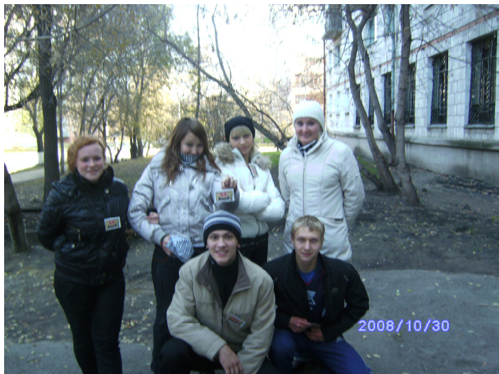
Интеллектуальные отроки -2008

Эта была наша третья попытка дойти до финала. Финала городского конкурса по историческому ориентированию. В первый год нам не хватило нескольких секунд. В следующем году нас сгубили