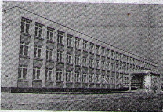
Новая школа № 45

В 1967—68 учебном году в Курганской области действовало 22 средних специальных